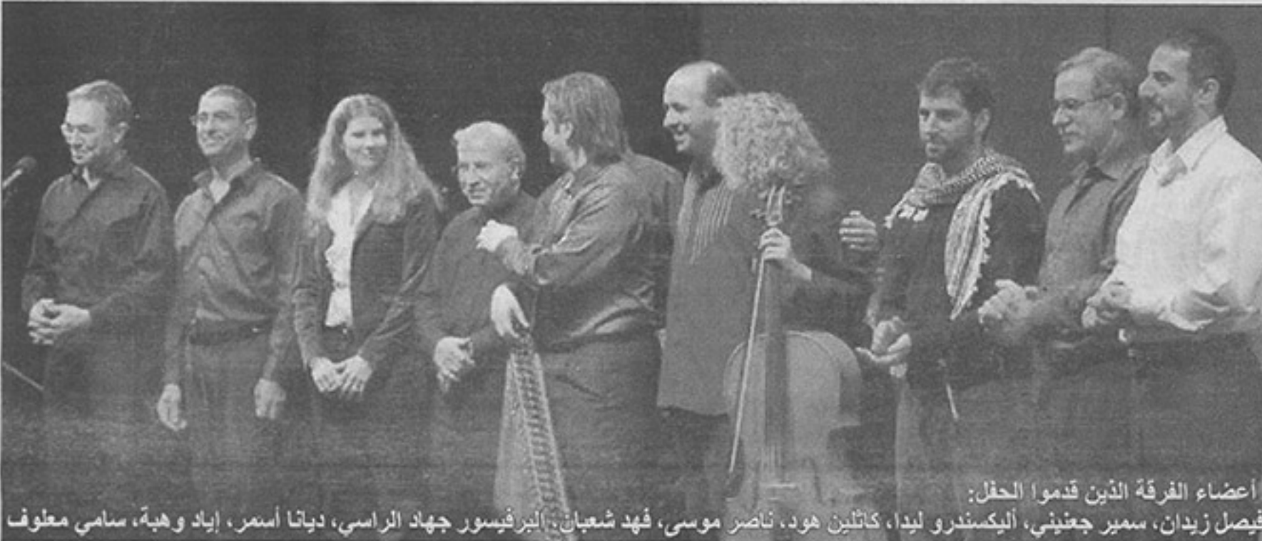
أعضاء الفرقة الذين قدموا الحفل: